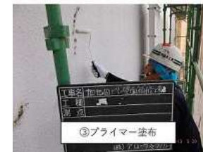
壁面防水塗装施工工事